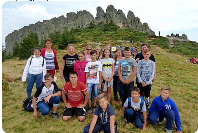
Madártávlatból csodálhatták a Máramarosi hegyeket.

Másnap a jó időnek köszönhetően az erdei és hegyvidéki túrázásnak szentelték az időt a Gutin-hegységben. Felkeresték a barcánfalvi ortodox kolostor fatemplomát, Európa második legmagasabb faépítményét.